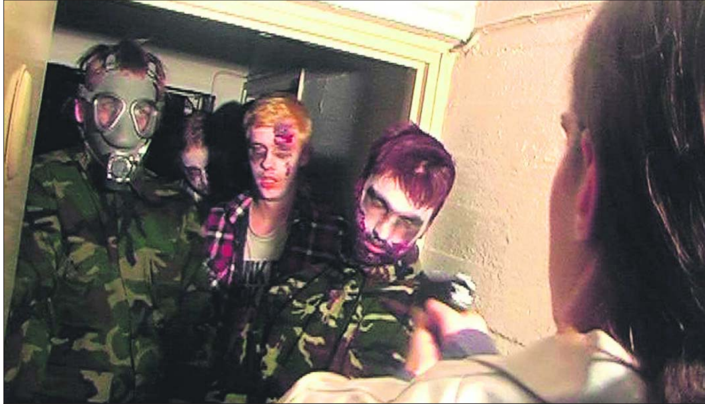
Parasite Quarantine keskittyy taisteluihin zombieiden kanssa. Zombie-näyttelijät tekivät työtä ilman palkkaa.

Parasite Quarantine on zombie-kauhuelokuva. Siinä joukko varusmiehiä jää vangiksi armeijan tutkimuslaitok-